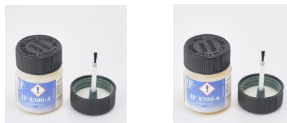
Abgebildetes Produkt kann vom gelieferten Produkt abweichen