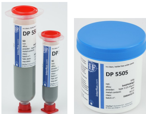
Abgebildetes Produkt kann vom gelieferten Produkt abweichen

Die Klassifizierung gemäß IPC und EN ist RO LO.